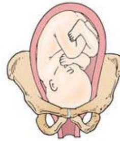
Right occiput posterior (ROP)