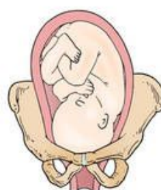
Left occiput posterior (LOP)