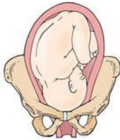
Right occiput anterior (ROA)