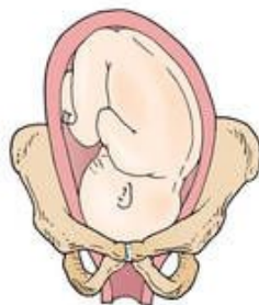
Left occiput transverse (LOT)