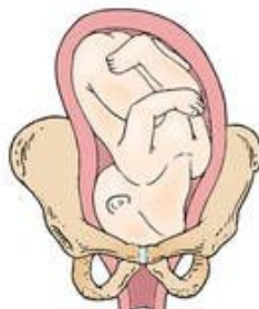
Left mentum anterior (LMA)