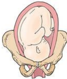
Right occiput transverse (ROT)