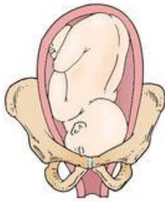
Right mentum posterior (RMP)