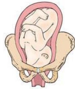
Right mentum anterior (RMA)