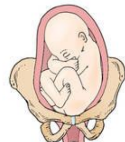
Left sacrum posterior (LSP)