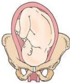
Left occiput anterior (LOA)