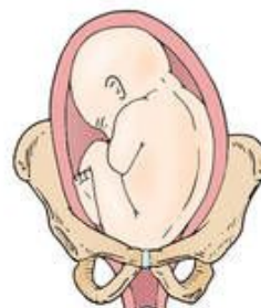
Left sacrum anterior (LSA)